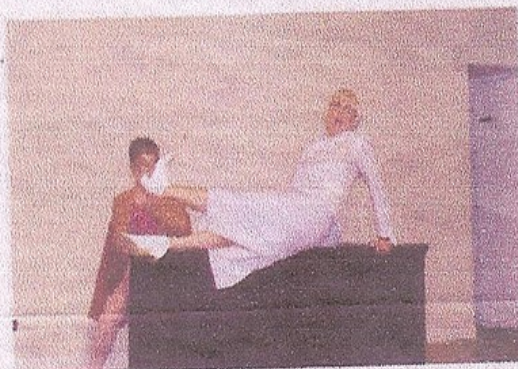
Conseils assez déjantés !